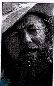
Fausto de Stefani

RIVA DEL GARDA - Fausto de Stefani, alpinista, uomo di profonda umanità e di concreta solidarietà, sarà presente oggi alle 21 all'hotel Astoria di Riva per una conferenza pubblica voluta dalla Sat e da Sopraimille nell'ambito del congresso internazionale «Sentieri di Salute, i saperi della montagna che aiuta». «Fausto de Stefani, un uomo, un bambino, una montagna»: il titolo della serata nella quale l'alpinista parlerà di montagna e delle sue esperienze di vita. De Stefani che ha scalato tutti e 14 gli ottomila, impegnato in campo naturalistico, è tra i fondatori di Mountain wilderness. Fotografo, documentarista, ha avviato progetti umanitari in Nepal, costruendo scuole e promuovendo sviluppo culturale.