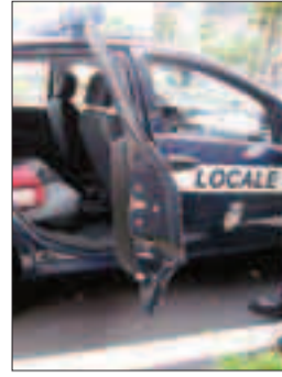
Una pattuglia della polizia

ALTO GARDA - Slitta, a data da destinarsi, il termine per l'apertura delle offerte per l'acquisto dell'immobile da destinare a sede del corpo intercomunale della Polizia locale. Il termine era stato fissato alle ore 14.30 del 22 marzo ma, come si legge in una nuova delibera della giunta della comunità di valle «considerato che l'apertura delle offerte deve essere effettuata dalla commissione di gara regolarmente costituita con la presenza della totalità dei componenti che saranno designati, e che non è stata ancora accertata la disponibilità da parte di tutti i componenti necessari, dotati delle qualificate competenze necessarie...», l'apertura è spostata a data da destinarsi e, comunque, «solo dopo l'avvenuto perfezionamento della nomina della commissione». La Comunità di valle alla fine ha optato per l'acquisto e sta cercando un immobile con caratteristiche volumetriche ed architettoniche degli spazi ben precise, ma anche che si trovi su alcune precise direttrici viabilistiche. Lu.Na.