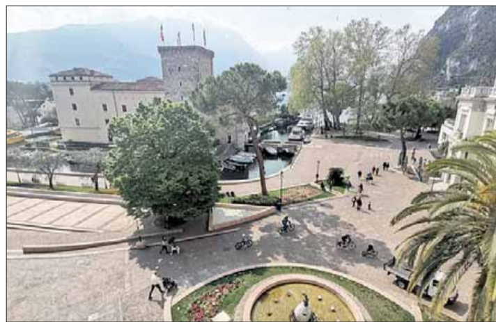
La Rocca, sede rivana del Museo Alto Garda, e la zona del Brolio